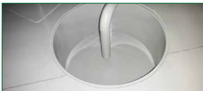
Revestimiento Novocoat SP2000AR Ceramic Coating en un registro de tanque