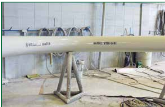
Novocoat SC2200 Rapid Set Pipe Coating aplicado en el exterior. Novocoat SC3300 Novolac Epoxy Lining aplicada en el interior.