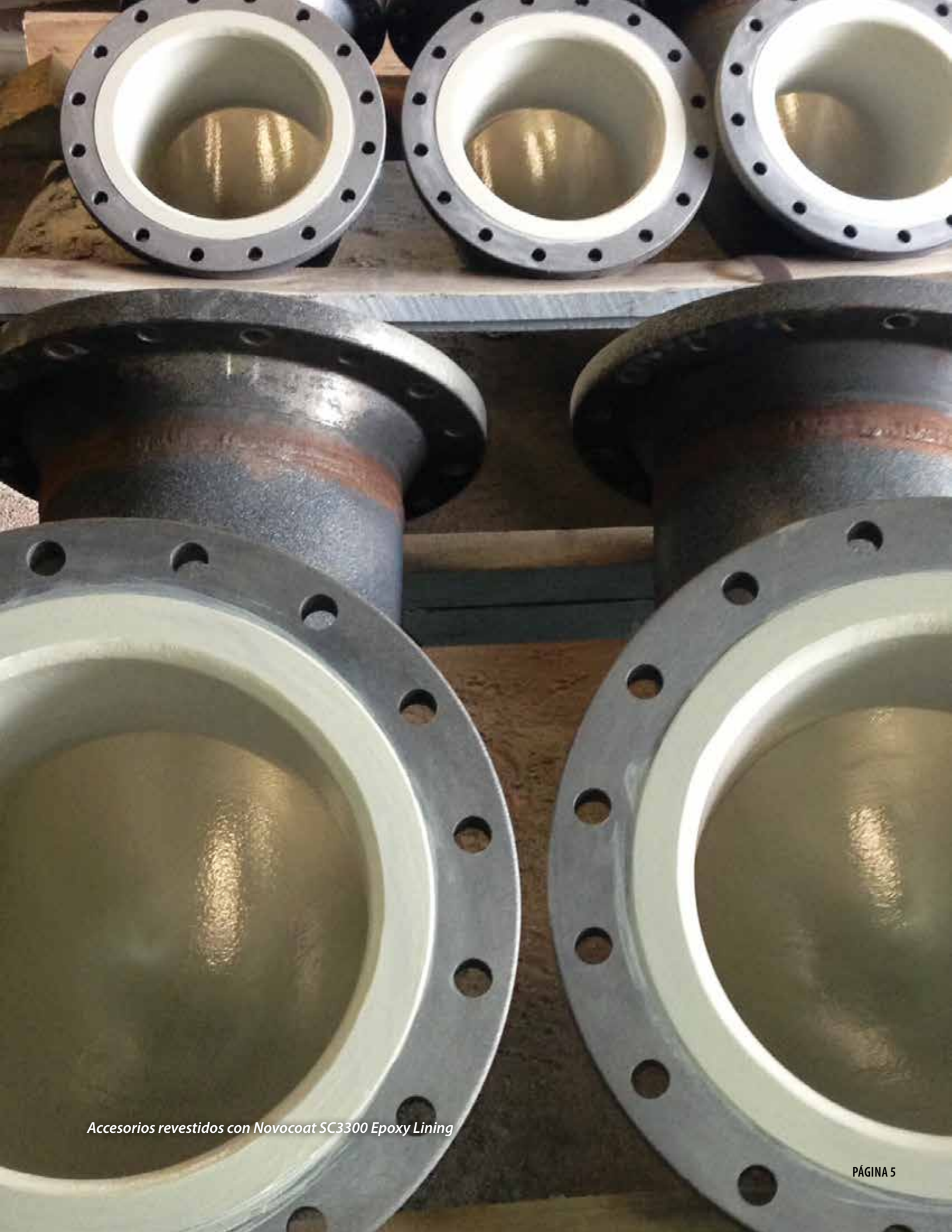
Accesorios revestidos con Novocoat SC3300 Epoxy Lining