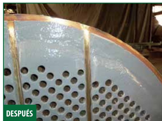
Lámina de tubo revestida con Novocoat EP5700 Ceramic Paste .