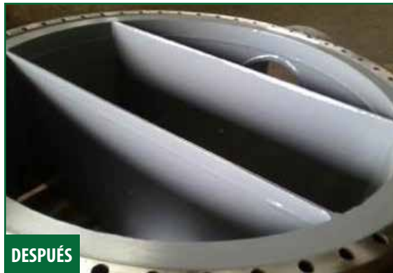
Acero piteado y desgastado reconstruido con Novocoat EP3900 Machinable Paste .