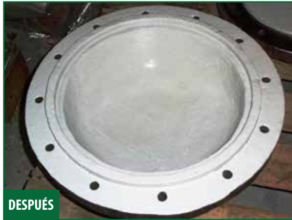
Cabezal flotante del intercambiador de calor antes y después de rellenar los hoyos en acero con Novocoat EP3900 Machinable Paste . Novocoat SC5400 Tank Lining aplicado como capa superior.