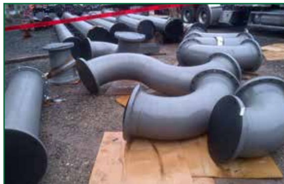
Novocoat DTM Epoxy aplicado en el exterior. Novocoat SC3300 Novolac Epoxy Lining aplicado en el interior.