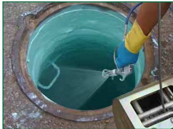
Aplicación de epóxico de alta construcción de película Novocoat SG2500 Lining .