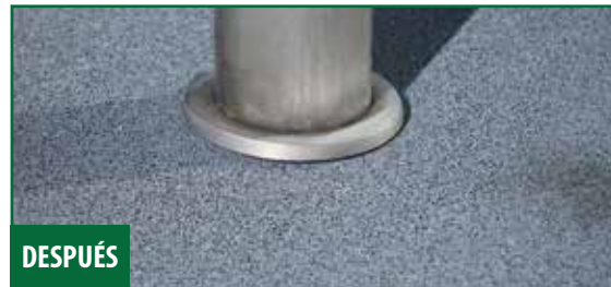
Novolite Repair Mortar usado en concreto.